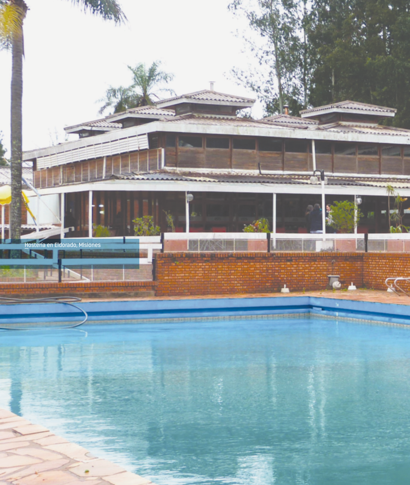
Hostería en Eldorado, Misiones