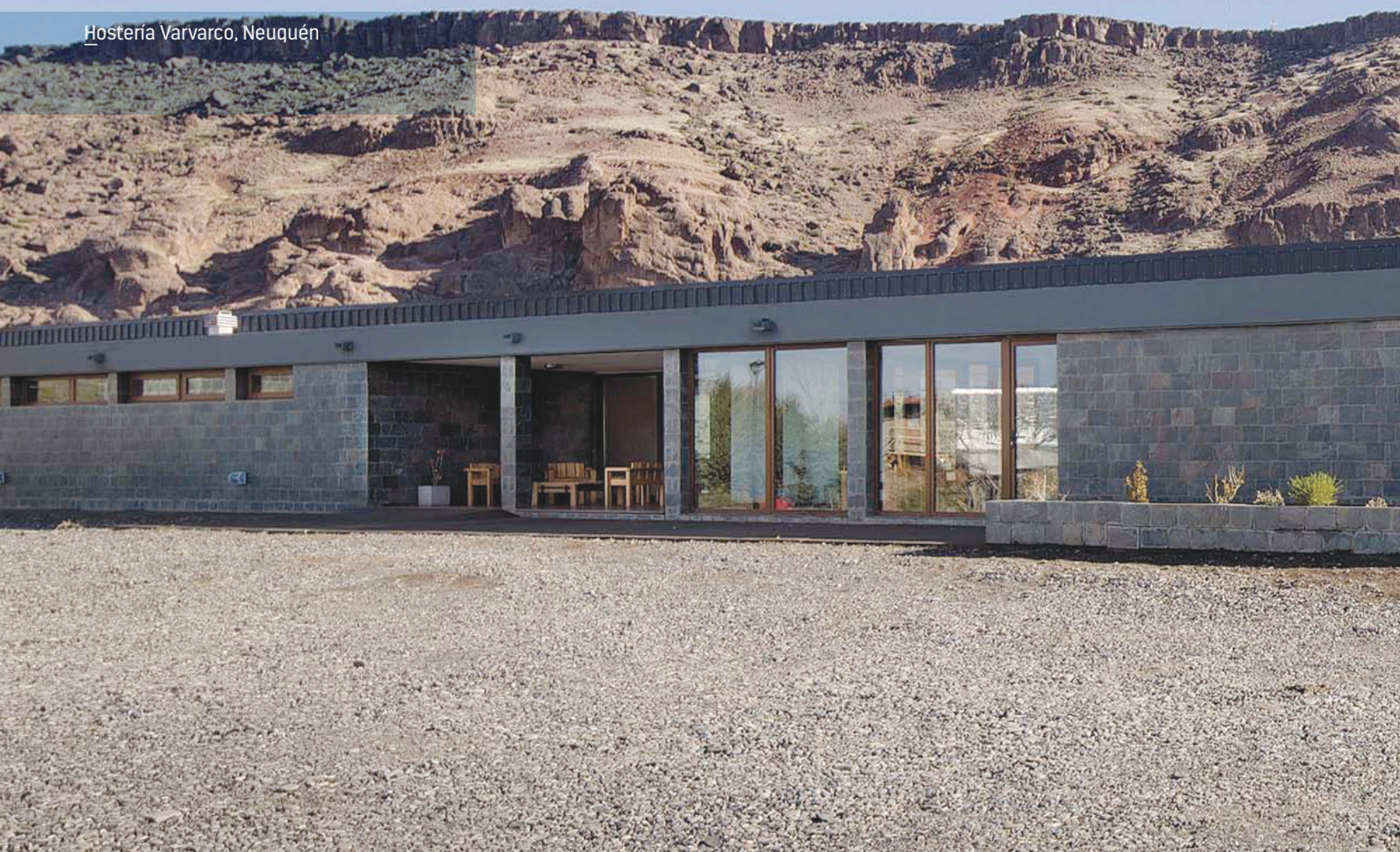
Hostería Varvarco, Neuquén