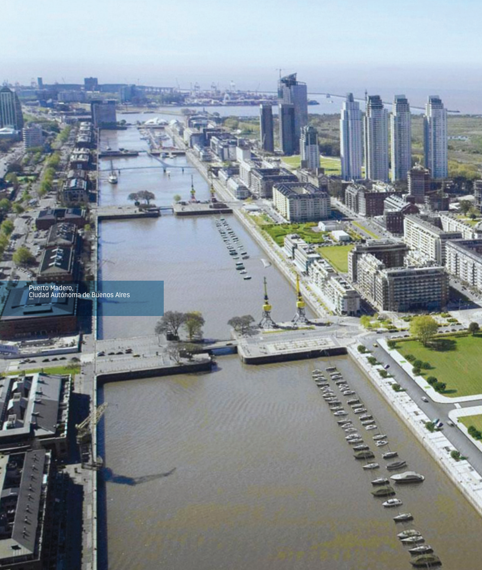
Puerto Madero, Ciudad Autónoma de Buenos Aires