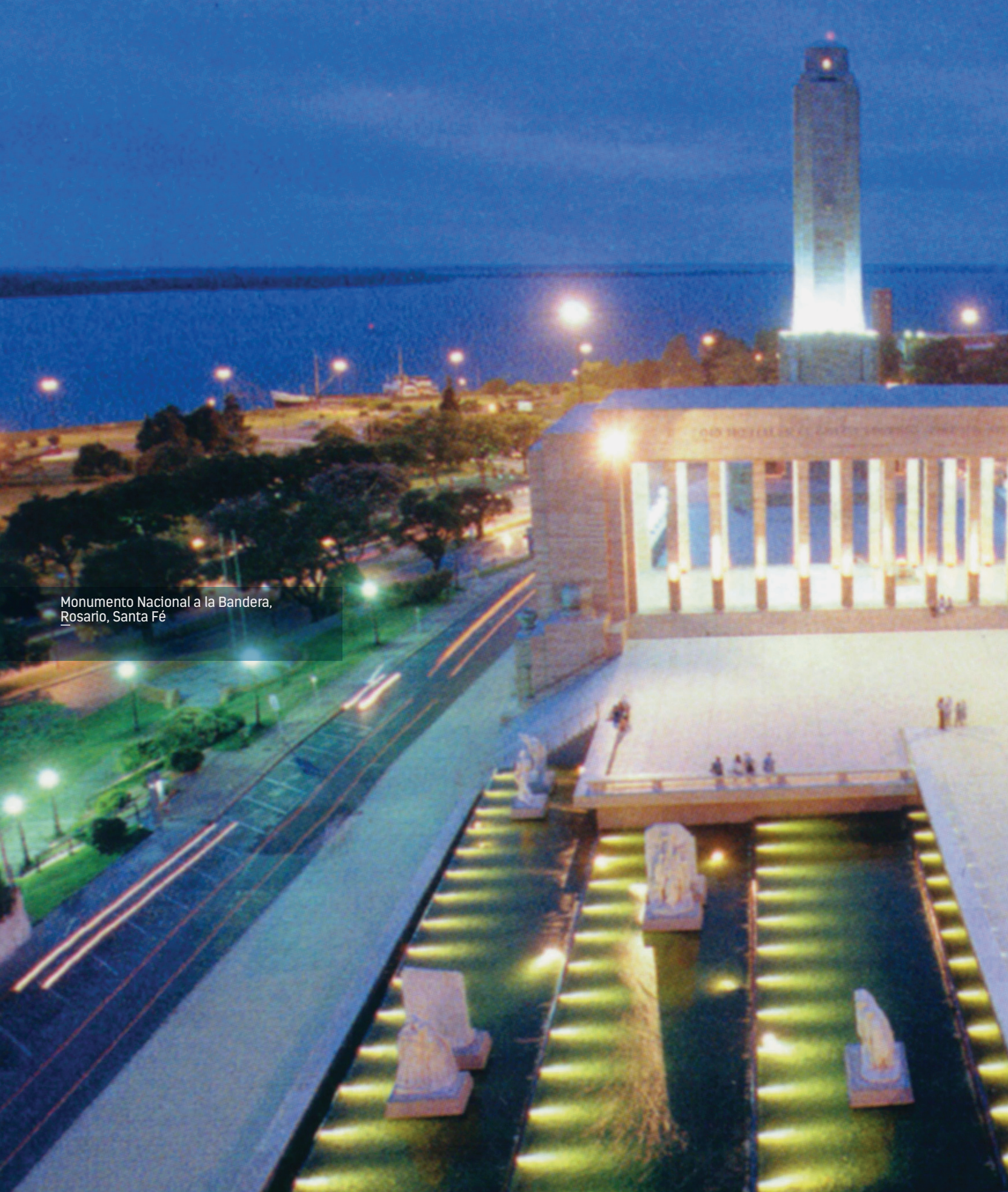
Monumento Nacional a la Bandera, Rosario, Santa Fé