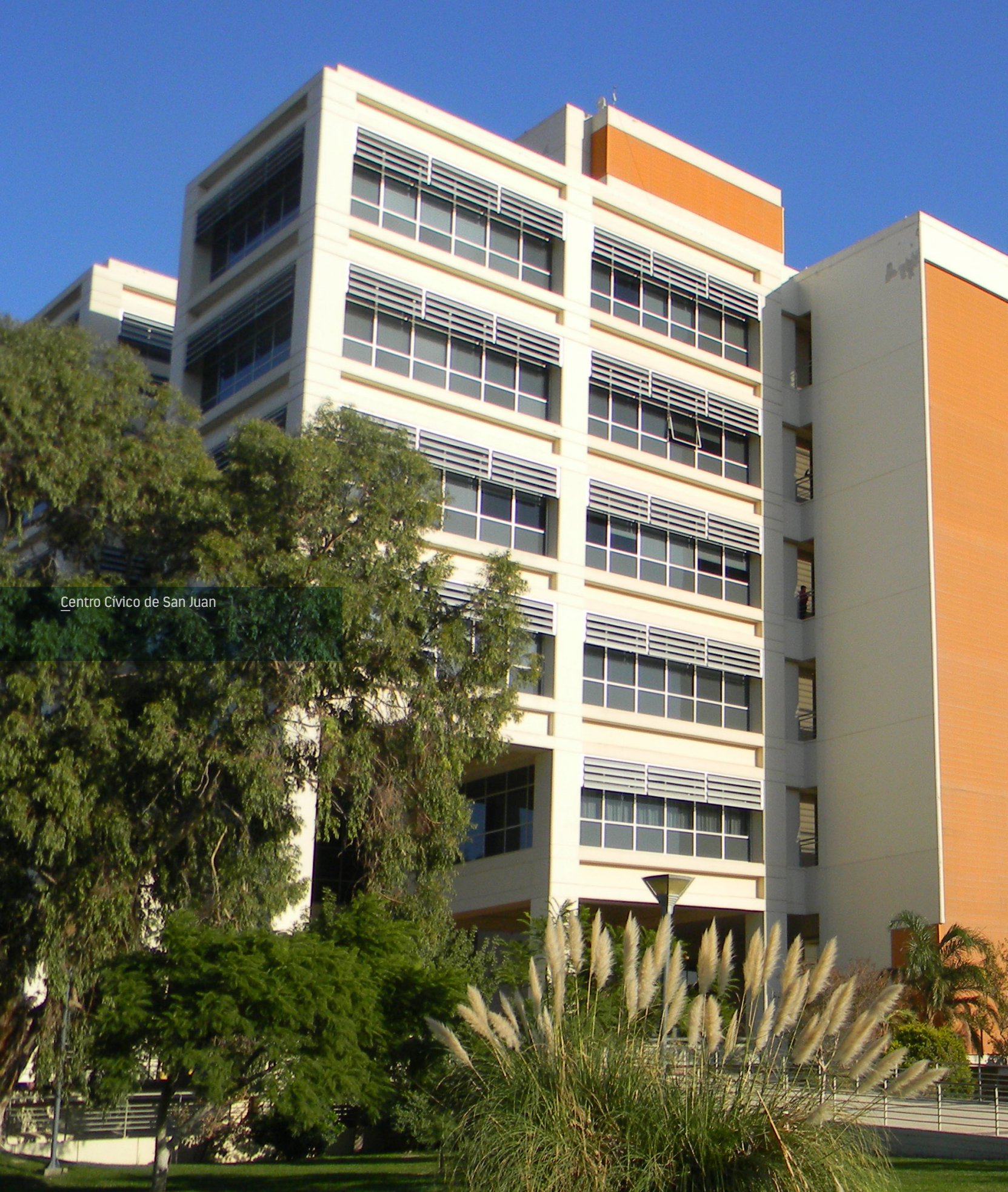
Centro Cívico de San Juan