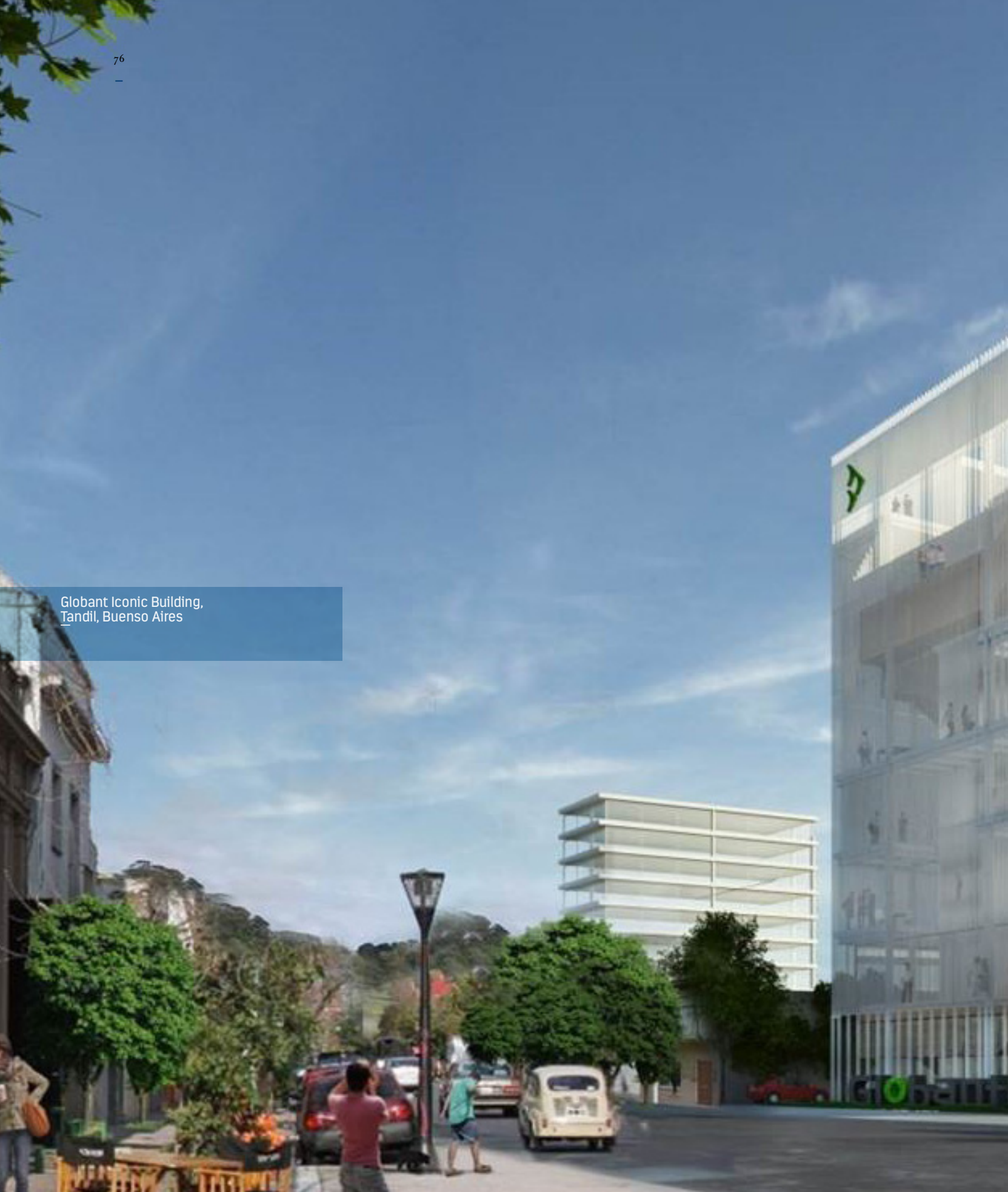
Globant Iconic Building, Tandil, Buenos Aires